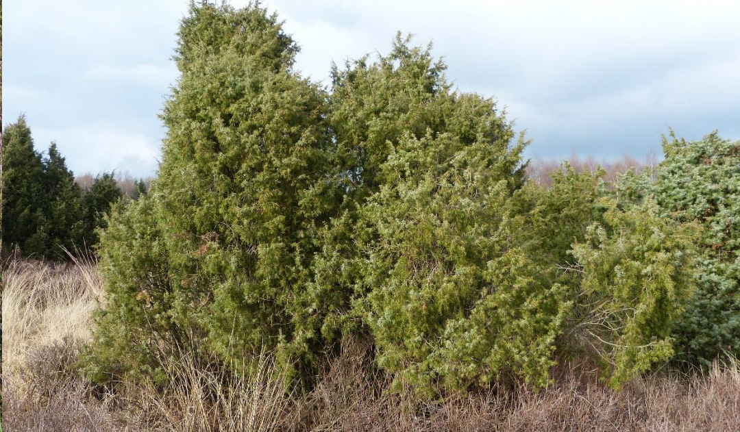
Fourrés de genévriers sur pelouse ou sur lande – habitat 5130