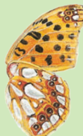
Flügel-Unterseite Face inférieure de l'aile