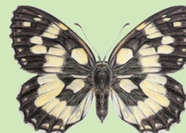
Schachbrettfalter Demi-Deuil Melanargia galathea