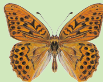
Kaisermantel Tabac d'Espagne Argynnis paphia