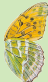
Flügel-Unterseite Face inférieure de l'aile