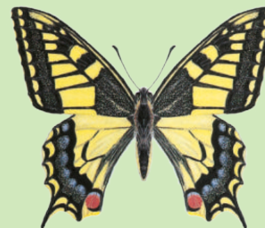
Schwalbenschwanz Machaon Papilio machaon