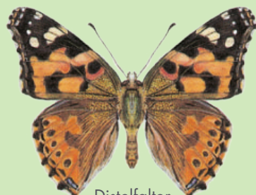
Distelfalter Vanesse des Chardons Vanessa cardui