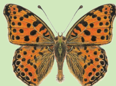
Kleiner Perlmutterfalter Petit nacré Issoria lathonia