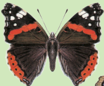
Admiral Vulcain Vanessa atalanta

A la fin de l'été, l'ensemble des données collectées fera l'objet d'une évaluation, ce qui nous permettra de découvrir quelle espèce de papillon a pu être observée à quel endroit. Les résultats seront évidemment publiés sur le site. De quoi vous réjouir de ce que l'automne vous préparera !