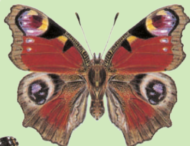
Tagpfauenauge Paon-du-jour Inachis io