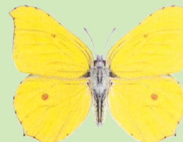
Zitronenfalter Citron Gonepteryx rhamni