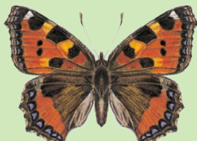
Kleiner Fuchs Petite Tortue Aglais urticae